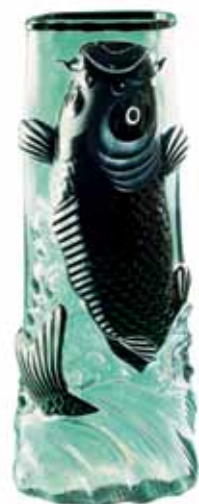
Jarrón con carpa, de vidrio revestido, fabricado por Eugène Rousseau en 1880. Éste forma parte de los numerosos artículos comprados por el Museo Nacional en el estudio del artista.