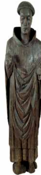
Figura de roble tallada de St. Molaise procedente de Inishmurray Island, condado de Sligo. La figura, que se remonta a finales del S. XIII o principios del XIV, permaneció en la iglesia de St. Molaise en esta isla hasta 1949.

Las galerías de exposición de los bloques sur y oeste están divididas a grandes rasgos siguiendo dos enfoques filosóficos distintos. En las tres grandes galerías del bloque sur, los encargados del museo seleccionaron material por categoría temática. En la primera planta hay una importante exposición de plata irlandesa y la planta segunda se consagra al mobiliario de época irlandés y a los instrumentos científicos. El mobiliario tradicional y la artesanía maderera irlandeses se muestran en la planta tercera. En las principales galerías del bloque oeste, se pretende, a través de la selección de material de diversas disciplinas y períodos, que el visitante conozca las colecciones nacionales, nuestra historia cultural y la historia del museo. En épocas recientes, el bloque este de Clarke Square ha sido utilizado para albergar la colección "Qué guardan los fondos", un moderno local de "almacenamiento a la vista" que permite contemplar importantes colecciones de objetos que, de no existir esta sala, no se mostrarían al público.