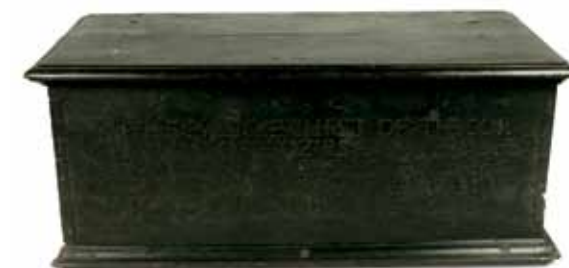
Aparador de roble de la Corporación (Gremio) de Artesanos del Fieltro de Dublín, de 1673. Los nombres del maestro y los operarios del gremio están tallados en el panel frontal.