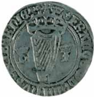
Moneda antigua de plata (de cuatro peniques), Enrique VIII y Jane Seymour, 1536-1537. El arpa es un símbolo de Irlanda, que se utilizó por primera vez en las monedas durante el reinado de este rey. La primera "acuñación de arpas" se efectuó entre 1534 y 1540; llevaba las iniciales de Enrique y de su reina en aquel momento.

La historia política es ilustrada por medio de medallas conmemorativas de diversos acontecimientos, comenzando por la Batalla del Boyne. La sección final de la exposición presenta el desarrollo de medallas en el siglo XIX en Irlanda, usadas en aquel momento para otorgar reconocimiento o méritos en diversos ámbitos.