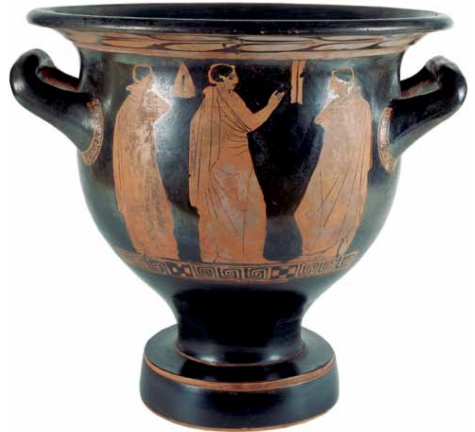
Crátera (vasija), tipo de figura roja, fabricada en Grecia durante el S. V a. C. Legada a la Sociedad Real de Dublín por George La Touche en 1825.

Fundada como la Dublin Society (1731) (Sociedad de Dublín) para impulsar la agricultura, industrias y otras artes prácticas, respondió a esta misión comenzando a recopilar maquinaria moderna agrícola e industrial. Sus escuelas de arquitectura y ornamentos, creadas en 1756, recogían muestras de arqueología clásica y moldes de escayola, que se empleaban posteriormente en las clases de estas materias. A finales del siglo XVIII, la sociedad adquirió, gracias a la financiación estatal, la colección de fósiles y minerales de Leskean de importancia internacional. Se desarrolló sobre este núcleo a través de la contratación de un geólogo que recogió minerales locales; todo ello se transfirió al Museo de Historia Natural de la sociedad al abrir éste en 1857. En otros ámbitos, la sociedad recopiló material de interés para sus miembros, desde "una hermosa obra de escritura realizada por una persona sin manos" hasta objetos