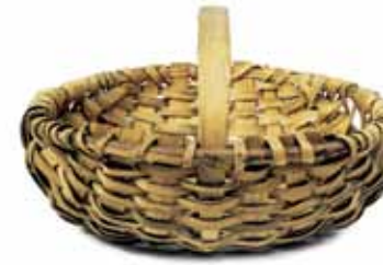
Cesta realizada con astillas de roble por Nicholas Hilliard, Ballinglen, condado de Wicklow, de 1950 aproximadamente.