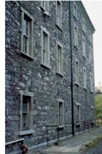
Retirada de los cuartos de baño y urinarios nocturnos, construidos en torno a 1891 y reforma de la pared del bloque norte con arreglo a su diseño original. Con motivo del traspaso de los cuarteles al Museo Nacional, la Oficina de Obras Públicas se encargó, con los arquitectos Gilroy McMahon, de comenzar la tarea de restaurar la Clarke Square a su gloria del S. XVIII.

Menos de veinte años más tarde, estos cambios estructurales mayores del cuartel jugaron un papel primordial en los asuntos militares, dado que se reunió en el lugar a una gran cantidad de soldados destinados a la Gran Guerra. Muchos murieron o fueron heridos en combate.