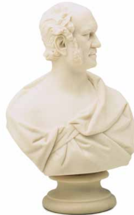
Busto de William Dargan, quien financió la Exposición Industrial de Dublín de 1853. Realizado en porcelana de Paros en Worcester.

Creado en su origen en 1845 como el Museo de Geología Económica, este museo cambió su orientación con rapidez a instancias de su primer director, Sir Robert Kane, que lo convirtió en el Museo de Industria Irlandesa y Escuela Estatal de las Ciencias. Partiendo del principio de la necesidad de una educación industrial para permitir a Irlanda explotar correctamente sus recursos y mejorar el nivel de vida de sus habitantes, el museo organizaba un programa de conferencias paralelo a las exposiciones. Este giro instruido encontró una gran oposición; ello se tradujo en el cierre del museo en torno a 1865 y a la transferencia de las colecciones a la Sociedad Real de Dublín. Aquí se ve expuesto un artículo perteneciente a la colección de aquel museo: el busto en porcelana de Paros de William Dargan, el contratista de ferrocarril que financió la Exposición Industrial de Dublín de 1853. Se realizó en Worcester en una época en la cual la fabricación de tal porcelana pertenecía a dos dublineses, W.H. Kerr y R.W. Binns, y se realizaban pruebas con arcilla de cerámica irlandesa a fin de establecer la fabricación de porcelana en Irlanda.