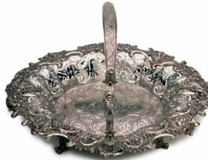
Cesta de pan en plata de estilo rococó, obra de Robert Calderwood, Dublín, de 1745 aproximadamente. De la colección del Conde de Milltown.

Los términos generales de diseño: "barroco", "rococó", "neoclásico", "victoriano" y "renacimiento celta" se utilizaron para agrupar a la plata cronológicamente. Las piezas seleccionadas para ilustrar estos diseños muestran que los plateros irlandeses comprendían y participaban del estilo de diseño del momento en Europa, si bien a su manera. Desde su fundación en 1637, la Compañía de Orfebres de Dublín ejercía el control sobre los plateros, de tal modo que aseguraba con marcas la garantía de calidad de las piezas de plata. No obstante, ante el temor de perder los metales preciosos durante su envío a Dublín, los plateros crearon sus propias marcas oficiales de platería en centros como Cork, Galway, Limerick, Kinsale y Waterford.