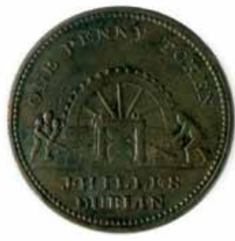
Vale de un penique en cobre, James Hilles, Leixlip y Dublín, 1813. Debido a la escasez de cambio durante las guerras napoleónicas, muchos comerciantes y fabricantes emitían sus propios vales, normalmente peniques y medios peniques.