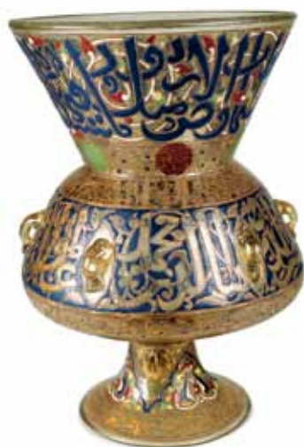
Lámpara de mezquita fabricada en El Cairo, Egipto, durante el reinado del Sultán al-Malik al-Nasir, 1310-1341, esmaltada con un verso del Corán y con el nombre del sultán.