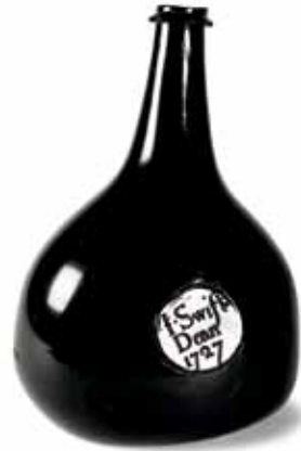
Botella fabricada para Jonathan Swift, probablemente en Dublín, en 1727 (año de publicación de la segunda edición de Los viajes de Gulliver). Por aquel entonces, defendía encarecidamente el uso de artículos de fabricación irlandesa.