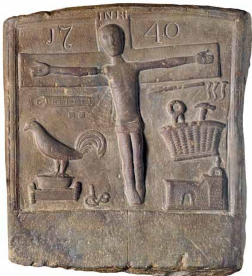
Piedra de altar de Summerhill, condado de Meath, S. XVIII. El tallado incluye símbolos de la crucifixión de Cristo, como el martillo, los clavos y la lanza.

Otro contraste lo representa un artículo de gran importancia internacional, el jarrón de Fonthill. Fabricado en porcelana de celadón, data de 1300 d. d. C. Cuando poco después se trajo a Europa, se trató como piedra semipreciosa y como tal se le añadieron engastes dorados de plata. Como los europeos no conocieron el modo de fabricar porcelana hasta unos cuatro siglos más tarde, estos objetos fueron tratados con gran respeto. Nos consta que el jarrón, que es una de las piezas mejor documentadas de porcelana china conocidas, formó parte a lo largo de los siglos de las colecciones de Luis el Grande de Hungría, Carlos III de Durazzo, el Delfín de Francia y William Beckford de Fonthill Abbey. Irreconocible debido a la retirada de los engastes en el siglo XIX, el jarrón fue adquirido por el museo en una subasta en 1882 por unas 28£.