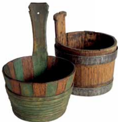
Recipientes de madera conocidos como "noggins" (tacitas), del S. XVIII o XIX, utilizados para contener alimentos como leche, gachas y patatas.

La celebración de las estaciones se refleja en la variedad de las cruces de Santa Brígida realizadas a principios de la primavera y en los nudos tejidos con paja como prendas de amor en tiempo de cosecha. Los símbolos de la devoción religiosa están representados por las cruces penales, los recuerdos de los peregrinos que visitaron St. Patrick's Purgatory, Lough Derg, y por los crucifijos de hueso muy desgastados, que dan testimonio de la devoción religiosa de los habitantes de la casa de Limerick.