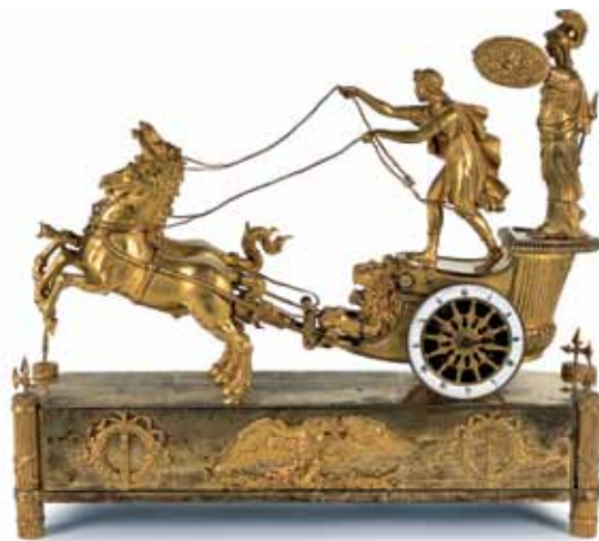
Reloj de pared francés, aprox. 1800. Esfera con forma de rueda de carro. Cuerpo compuesto por dos caballos conducidos por una figura masculina, bajo la protección de Minerva (diosa de la sabiduría).

Este local también incorpora algunos instrumentos científicos de importancia, abarcando desde el siglo XVII hasta el siglo XX, así como la colección de relojes del museo, la mayor parte de los cuales pertenece al período 1750-1850. Todo ello, así como la colección de plata de Sheffield, electrotipos, aleaciones, latón, bronce, plata y joyería, se halla en la sección cuarta.