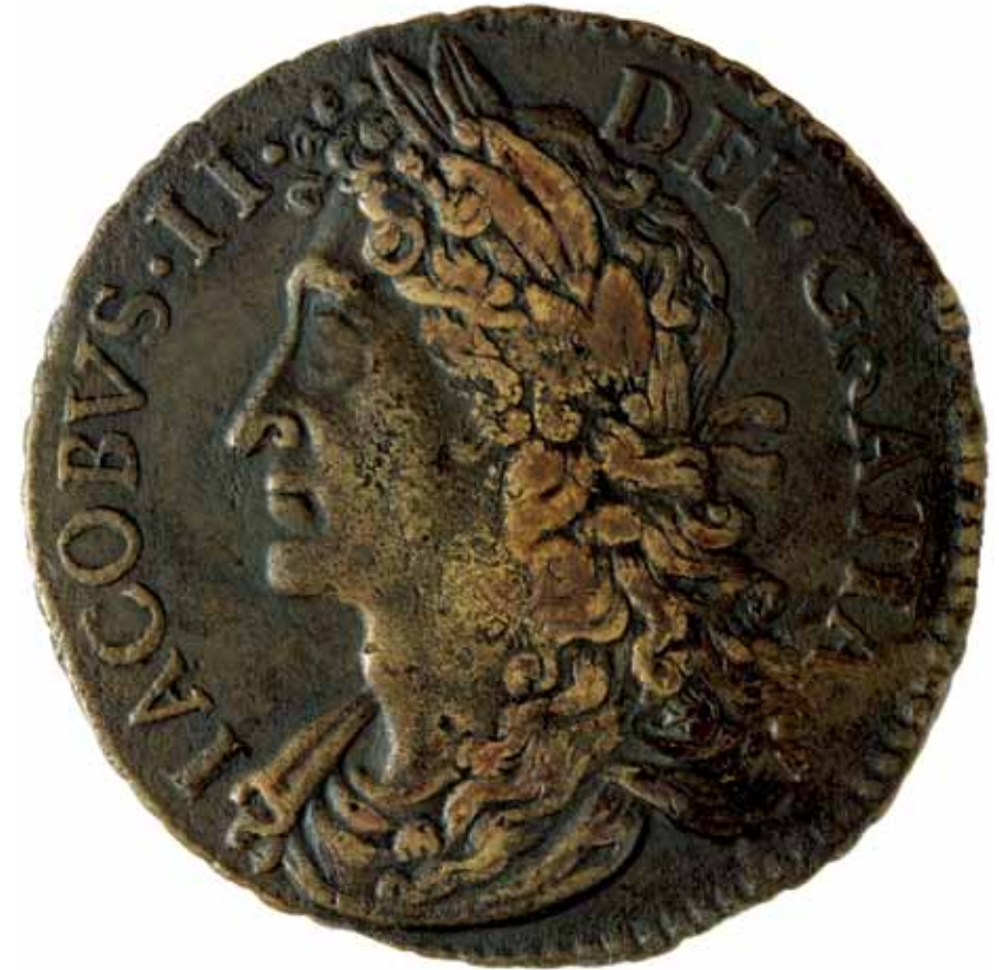
Media corona de "dinero de artillería" en cobre, Jaime II, 1689. Acuñación de emergencia producida a partir de cañones y restos de metal fundidos; el dinero de artillería fue utilizado por Jaime II para pagar a sus tropas y financiar la guerra contra Guillermo III. Este dinero fue devaluado por los victoriosos guillermistas en 1691.

Una sección principal trata el concurso de 1926, que dio como resultado la producción de la primera acuñación independiente de Irlanda. La historia continúa con el proceso de decimalización en 1971 y culmina con la introducción del euro en 2002.