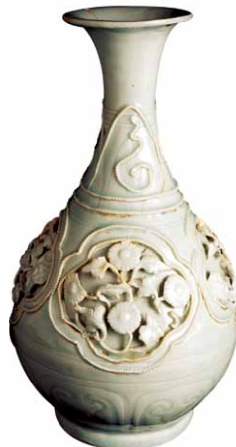
El jarrón de Fonthill, fabricado entre 1300 y 1340, es una de las piezas mejor documentadas y más conocidas de la primera porcelana china.

Otro contraste lo representa un artículo de gran importancia internacional, el jarrón de Fonthill. Fabricado en porcelana de celadón, data de 1300 d. d. C. Cuando poco después se trajo a Europa, se trató como piedra semipreciosa y como tal se le añadieron engastes dorados de plata. Como los europeos no conocieron el modo de fabricar porcelana hasta unos cuatro siglos más tarde, estos objetos fueron tratados con gran respeto. Nos consta que el jarrón, que es una de las piezas mejor documentadas de porcelana china conocidas, formó parte a lo largo de los siglos de las colecciones de Luis el Grande de Hungría, Carlos III de Durazzo, el Delfín de Francia y William Beckford de Fonthill Abbey. Irreconocible debido a la retirada de los engastes en el siglo XIX, el jarrón fue adquirido por el museo en una subasta en 1882 por unas 28£.