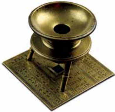
Probador de lino, Seward, Dublín, mediados del S. XVIII. Lupa utilizada para medir la densidad de las fibras del paño de lino a fin de garantizar el control de calidad.