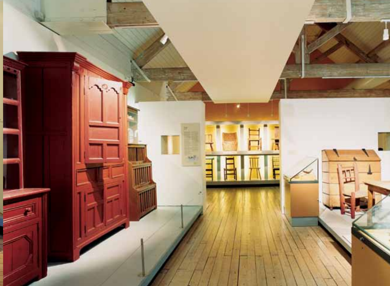
Vista general de la galería "Mobiliario de época irlandés" que muestra un arcón para guardar la harina, así como tipos diversos de armarios y sillas.

Esta galería, que es una celebración de la fabricación de muebles irlandeses desde el siglo XVII, finaliza con las magníficas piezas de satín realizadas por James Hicks, Dublín, a finales del siglo XIX o principios del siglo XX y con el mobiliario tubular de cromo diseñado por el arquitecto Raymond McGrath en 1930 para la sede central de la B.B.C. en Londres. A ello se unen las piezas contemporáneas fabricadas en The Furniture College, Letterfrack, y por otros dotados jóvenes fabricantes de armarios que trabajan en el Comité de Artesanía de Dublín en la actualidad.