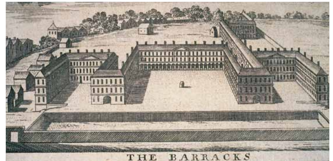
Vista de los cuarteles, tomada del libro "A Map of the city and suburbs of Dublin" ("Plano de la ciudad y alrededores de Dublín) de Charles Brooking, 1728.