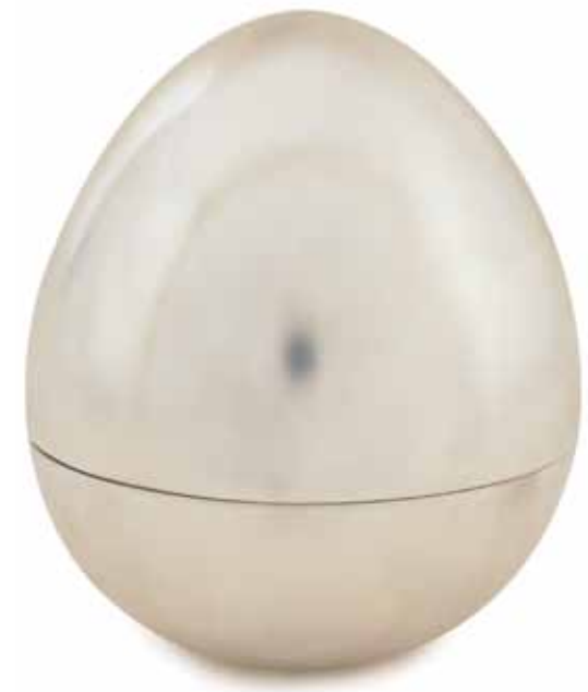
Carrito del té, obra de Jennifer Walsh, Dublín, 1997. Forma parte de la colección de plata de los estudiantes de la Escuela Nacional de Arte y Diseño, la cual se halla en el Museo Nacional.

La División de Arte e Industria del Museo Nacional también monta exposiciones temporales en las Collins Barracks de forma periódica. Estas exposiciones han abarcado una gran variedad de temas, como la competición de plata contemporánea anual organizada conjuntamente por el Museo y la Escuela Nacional de Arte y Diseño; vidrio noruego; la vida de John Wesley; bellas artes y artes decorativas neoceltas; armas de fuego de la familia Rigby; arte de vidrio irlandés contemporáneo; juegos y juguetes. Este programa variable de exposiciones temporales ha ganado nuevo vigor con la reforma de la escuela de equitación del cuartel como lugar de exposición, que terminó en enero de 2005. Ello ha permitido al museo desarrollar y expandir la diversidad de sus exposiciones temporales.