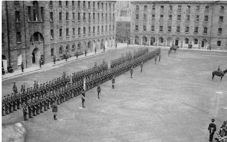
El 1er batallón, 62 regimiento (Wiltshire) en el desfile del Día de Ferozeshah en las Royal Barracks, Dublín, en 1921. (Este desfile anual conmemoraba la Batalla de Ferozeshah, que tuvo lugar el 21 y 22 de diciembre de 1845, durante la primera guerra sikh en el norte de la India. El Comandante en Jefe del regimiento durante esta Guerra era un irlandés, Sir Hugh Gough).

Se cuenta que durante un breve período de tiempo, el cuartel también sirvió como residencia al Vicerrey, tras el asesinato del Secretario Jefe, Lord Frederick Cavendish, y el Vicesecretario, Thomas Burke, en el Phoenix Park el 6 de mayo de 1882.