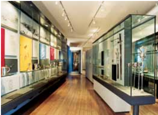
Vista de la galería "Plata irlandesa" que muestra, a la izquierda, ejemplares de la plata provincial. A la derecha hay mazas y cajas de libertad (estuches que contenían documentos de declaración de libertades), fabricadas para utilizarse en ceremonias. En el centro se ve una lámpara de santuario de estilo neocelta.

Las colecciones que se muestran actualmente en la tercera planta proceden de una selección de la División Etnográfica Irlandesa.