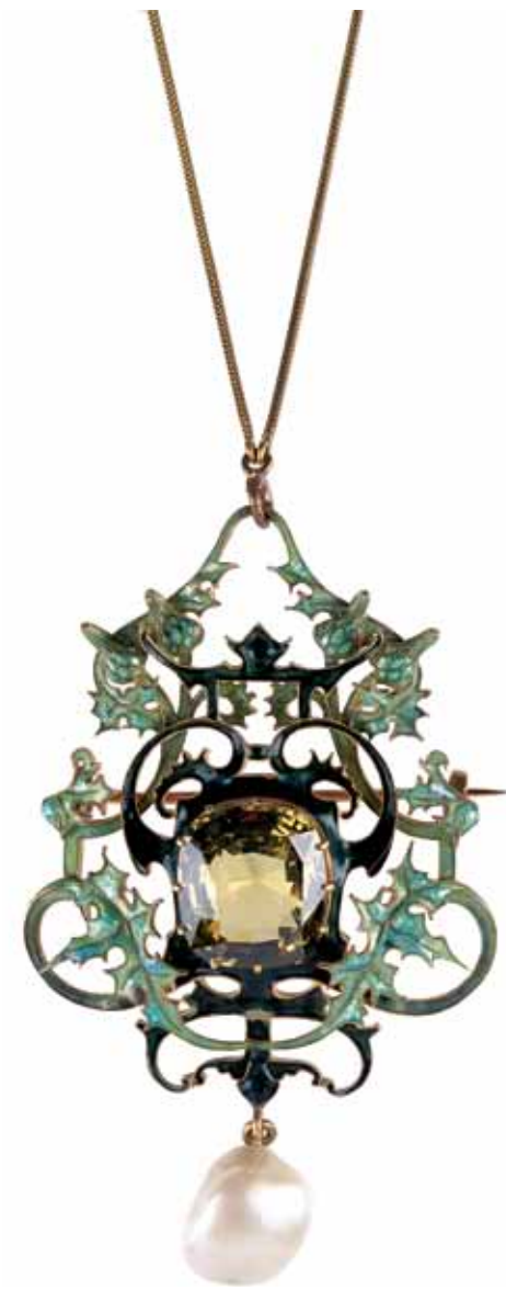
Pendiente esmaltado con un diseño en forma de hoja de cardo, con una crisolita insertada en el centro y una enorme perla suspendida. Fabricado por el famoso diseñador de joyas, René Lalique, en París, en 1901.

Asociada a éstas, se muestra una galería de joyería con colecciones que abarcan desde el siglo XVII hasta nuestros días. Adquirida para ilustrar y animar el diseño de calidad, la colección incluye piezas realizadas por joyeros de prestigio, como Carlo Giuliano, Fortunato Castellani y René Lalique. A su lado se encuentran los camafeos e intaglios venerados por los intelectuales irlandeses, así como los micromosaicos y marfiles tallados comprados por irlandeses de viaje por Europa. También se exhiben aquí piezas realizadas en crin de caballo por las clases más desfavorecidas, así como figuras en bog oak (roble hallado en turberas) y joyería del Renacimiento Celta, identificado con Irlanda. Esta colección, obtenida durante los últimos 130 años, muestra que la joyería se producía en Irlanda y que no estaba realizada en metales y piedras caras.