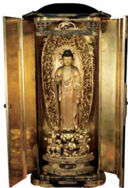
Altar doméstico de Amidanyorai Zazo, una deidad que promete ayuda en esta vida y el cielo en la siguiente a los que creen en él. Japonés, Período Edo Medio (S. XVIII).