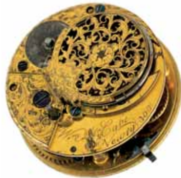
Reloj en movimiento de bronce, de 1780 aproximadamente. Firmado por el fabricante, William McCabe, que trabajó en Newry, condado de Down, de 1772 a 1785.

Este local también incorpora algunos instrumentos científicos de importancia, abarcando desde el siglo XVII hasta el siglo XX, así como la colección de relojes del museo, la mayor parte de los cuales pertenece al período 1750-1850. Todo ello, así como la colección de plata de Sheffield, electrotipos, aleaciones, latón, bronce, plata y joyería, se halla en la sección cuarta.