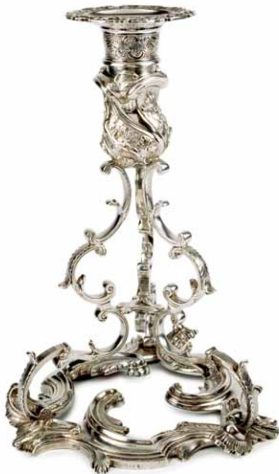
Candelabro de plata de estilo rococó, Dublín, de 1745 aproximadamente. Fabricante desconocido.