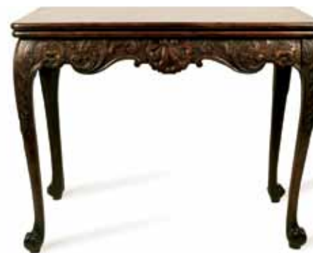
Mesa para jugar a las cartas en caoba, irlandesa, de 1760 aproximadamente. Tallada con espirales contra un fondo de tramas en cruzado.

Irlanda es bien conocida por sus estilos distintivos de mobiliario de caoba realizados en torno a mediados del siglo XVIII. Diversos estilos colocados próximos unos a otros muestran la sencilla mesa de caza irlandesa, que contrasta con la delicadeza de las patas talladas y los pies trífidos de la mesa de plata. En sus proximidades se halla una mesa para jugar a las cartas con patas talladas con conchas, círculos y flores, con pies en espiral, que puede compararse a la cercana mesa de arquitecto tallada con cuidado y con enormes pies en forma de garra.