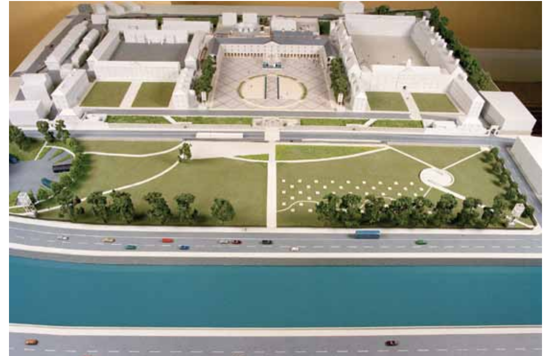
Maqueta arquitectónica correspondiente a la siguiente fase del plan de desarrollo del complejo, en el cual se incorpora una zona de recepción y otra de exposición en el emplazamiento de las antiguas Royal Square o Grand Square

A lo largo del siglo XVIII, las obligaciones de los soldados oscilaban entre hacer guardia oficial en el Castillo de Dublín y tareas de carácter civil en