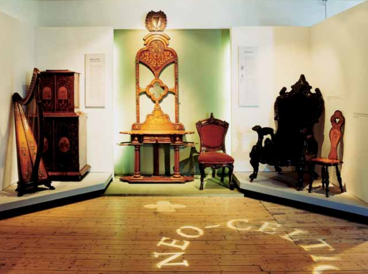
Vista de la sección neocelta de la galería "Mobiliario de época irlandés", que muestra ejemplares fabricados en Belfast, Killarney y Dublín entre 1850 y 1910.

A finales del siglo XVIII, cuando el mobiliario irlandés seguía estrechamente la moda de Londres, había fabricantes de armarios, como William Moore (que había sido aprendiz en Londres en la compañía de Mayhew and Ince) que desarrollaban su propio estilo distintivo. Del mismo modo, las piezas del siglo XIX realizadas por los fabricantes de armarios de Dublín, Limerick y Kilkenny mostraban cómo seguían, a su manera, los estilos de moda de aquel momento. Las delicadas incrustaciones de la obra de Killarney de la década de 1840 aproximadamente y la obra de pirograbadores de Belfast de la década de 1890 muestran que algunos centros habían desarrollado su arte para mercados y clientes concretos, como el turismo.