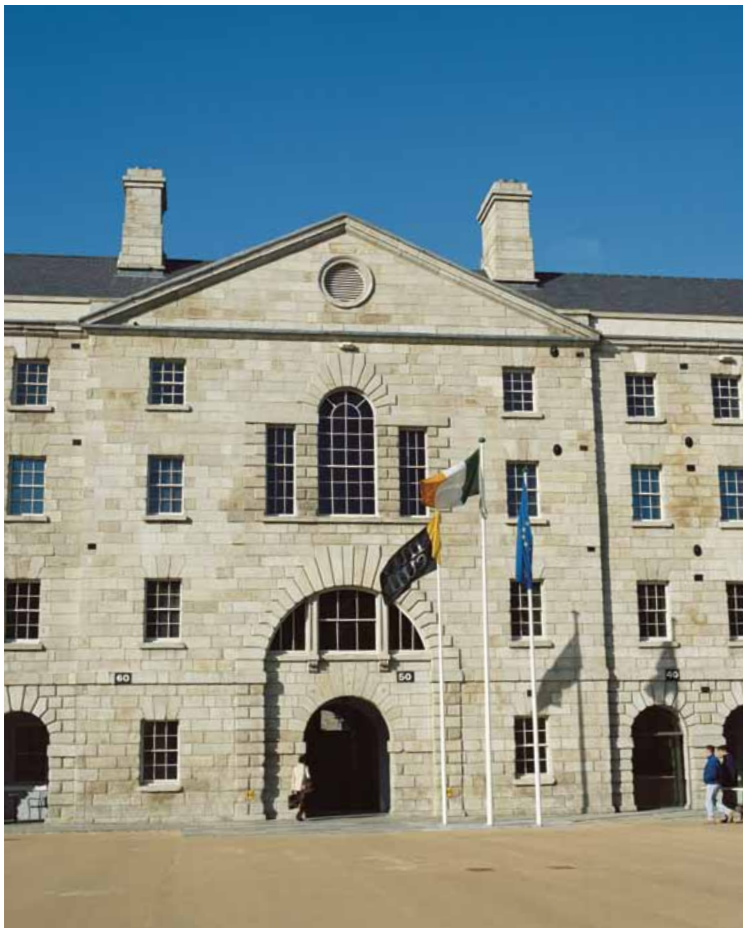
Vista del bloque oeste de Clarke Square, que muestra la entrada actual a las exposiciones. Cuenta la tradición que el corredor abovedado y la ventana fueron construidos para permitir a la Reina Victoria permanecer en el interior mientras pasaba revista a las tropas.