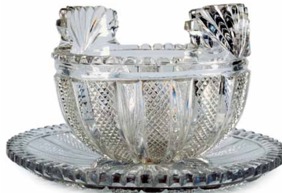
Cuenco y soporte realizado en Waterford, en 1820 aproximadamente. Ésta fue la primera pieza de cristal irlandés antiguo adquirida por el Museo de Ciencia y Arte.

En 1877 el Gobierno aprobó una ley parlamentaria que establecía un nuevo museo en Dublín, con la intención de que "los irlandeses aprovecharan al máximo la oportunidad de mejora en el cultivo de las artes industriales y decorativas". Gracias al asesoramiento del museo de South Kensington en Londres, se comenzó a adquirir material de forma inmediata procedente de colecciones privadas de renombre internacional. Por ejemplo, se seleccionaron artículos contemporáneos de calidad directamente de Tiffany y William de Morgan, así como de localidades irlandesas como Vodrey, Pugh y Belleek. También se recogieron obras que representasen las "cunas de las civilizaciones del mundo": el Mediterráneo clásico, la India y China. La nueva institución se concentró asimismo en artículos que ilustrasen el desarrollo económico e industrial de Irlanda, en concreto a partir del S. XVII. Como resultado de esta dinámica política de adquisiciones, las colecciones se vieron muy enriquecidas. De hecho, cuando se abrieron las nuevas instalaciones de Kildare Street en 1890, algunas colecciones siguieron exhibiéndose en la Leinster House debido a la falta de espacio.