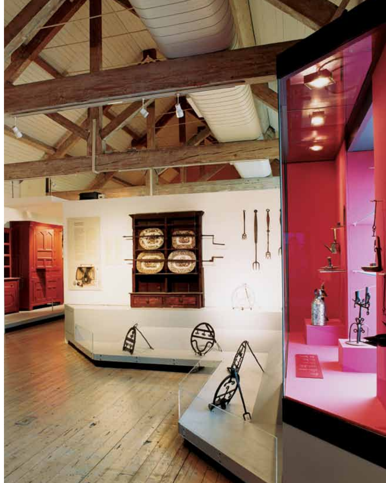
Radharc den áiléar 'Trosacán Tuaithe na hÉireann', a thaispeánann uirlisí cócaireachta agus soilsithe éagsúla.