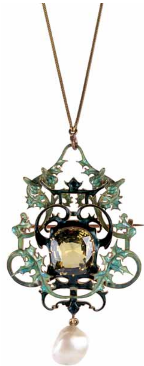
Siogairlín cruanta i ndearadh duilleog feochadáin, inleagtha le crisilít sa lár agus le péarla mór ar crochadh. Arna dhéanamh ag an dearthóir seodra clúiteach, René Lalique, i bPáras, 1901.

Ag baint leis seo tá áiléar seodra ina bhfuil bailiúcháin a bhaineann leis an 17ú haois anonn go dtí an lá inniu. Ceannaíodh iad seo le dearadh ar ardchaighdeán a léiriú agus a spreagadh. Tá píosaí sna bailiúcháin le seodóirí móra le rá cosúil le Carlo Giuliano, Fortunato Castellani agus René Lalique. Taobh leo seo tá caimeo agus cineálacha intaglio a thaitin le hintleachtaigh na hÉireann agus na mionmhósáicí agus na píosaí d'eabhar snoite a cheannaigh taistealaithe na hÉireann. Anseo chomh maith tá píosaí róin a rinne na bochtáin, chomh maith le píosaí snoite den dair phortaigh agus seodra ón athbheochan Cheilteach a shamhlaítear le hÉirinn. Léiríonn an bailiúchán seo a cruthaíodh thar thréimhse 130 bliain, gur táirgeadh seodra in Éirinn agus nach i gcónaí gur de mhiotail agus de chlocha daora a bhí sé déanta.