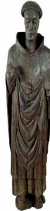
Naomh Molaise, snoíodóireacht darach ó Oileán Inis Mhuirigh, Co. Shligigh. Sheas an fíor, a bhaineann leis an 13ú haois dhéanach nó an 14ú haois luath, i Séipéal Naomh Molaise ar an oileán go dtí 1948.

Tá na háiléir taispeántais sna Bloic Thiar agus Theas roinnte go ginearálta idir dhá chineál cur chuige fealsúnach. Roghnaigh na coimeádaithe an t-ábhar don trí áiléar mhóra sa Bhloc Theas ar bhonn téamúil. Ar an gcéad urlár tá taispeántas mór d'airgead na hÉireann agus ar an dara hurlár tá troscán seanré na hÉireann le feiceáil mar aon le gléasanna a bhain leis an eolaíocht. Tá troscán traidisiúnta na hÉireann agus ceardaíocht adhmaid le feiceáil ar an tríú hurlár. Is í an aidhm a bhaineann leis na háiléir ar an mBloc Thiar ná léargas a thabhairt do chuariteoirí ar na bailiúcháin náisiúnta agus ar ár stair chultúrtha agus ar scéal an mhúsaem trí ábhar a roghnú agus a chur ar taispeáint ó dhisciplíní agus ó thréimhsí éagsúla. Le deireanas úsáideadh Bloc Thoir Chearnóg Uí Chléirigh chun an mhír 'Cad atá sa stór?' a choinneáil, is áis nua-aimseartha stórála é a ligeann do chuariteoirí bailiúcháin thábhachtacha de dhéantáin a fheiceáil nach mbeadh ar fáil don phobal gan é.