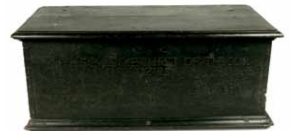
Cófra daire de Chorporáid (Gild) na nDéantóirí Feilte, Baile Átha Cliath, 1673. Tá ainmneacha mháistir agus mhaoir an ghild snoite ar an bpainéal tosaigh.