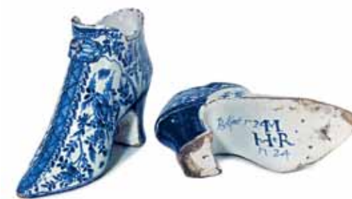
Bróga potaireachta glónraithe le stáin agus maisithe le bláthanna agus duilliúr sa stíl Síneach. Béal Feirste, 1713 agus 1724.

Ní raibh bailiúchán na hÁise ar taispeáint ó osclaíodh Dún Uí Choileáin sa bhliain 1997. Tá laicear, greallóg, eabhar, cruán, dealbha, péintéireacht agus míotalóireacht le feiceáil sa dara agus sa tríú cuid den stór. Anuas air sin, tá cuid de bhailiúcháin chriadóireachta an mhúsaem le feiscint laistigh den dara cuid. Tá ábhar tábhachtach Éireannach cosúil le créghréithe Bhéal Leice, Vodery, Queen's Institute, Charraig Uí Leighin agus ealaín chriadóireachta chomhaimseartha san áireamh, i gcomhar le maiolica Spáinneach agus Iodáileach, poirceallán Seapánach, blanc-de-chine ón tSín, Wedgwood, earraí cruachré ón nGearmáin, faience na Fraince, criadóireacht Ioslamach, agus créghréithe Olannacha.