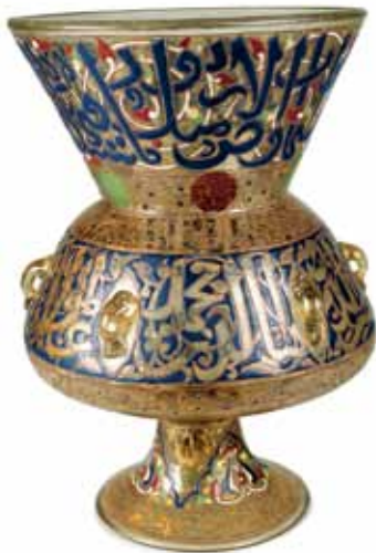
Lampa mosca a rinneadh ag Cairo na hÉigipte, i réimeas an tsabhdáin al-Malik al-Nasir, 1310-1341, agus véarsa cruanta air ón Qur'an in éineacht le hainn an tsabhdáin.