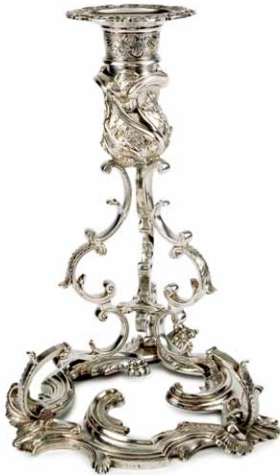
Coinnleoir airgid sa stíl rocócó, Baile Átha Cliath, c.1745. Ní fios cé a rinne.