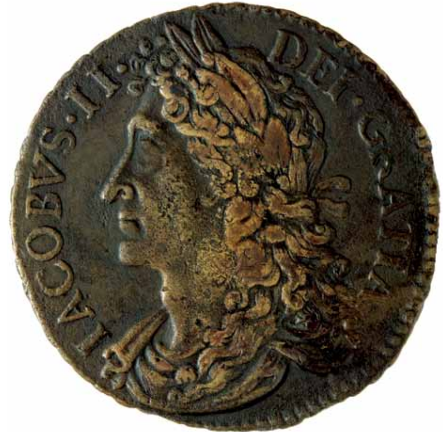
Leathchoróin airgead gunna, cupar, Séamas II, 1689. Monaíocht éigeandála ab ea í seo a rinneadh as bairéil ghunnaí móra agus dramh-mhiotal leáite, agus a d'úsáid Séamas II chun a thrúpaí a íoc agus an cogadh in éadan Uilliam III a mhaoiniú. Chuir na Uilliamáitigh bhuacacha deireadh leis mar mhonaíocht sa bhliain 1691.

Baineann cuid ollmhór le comórtas 1926 a raibh mona neamhspleách na hÉireann de thoradh air. Leanann an scéal ar aghaidh le deachúlú sa bhliain 1971 agus ar aghaidh go dtí teacht isteach an euro sa bhliain 2002.