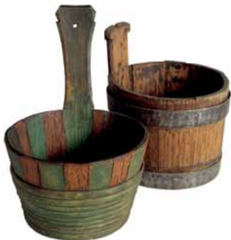
Coimeádáin adhmaid ar a dtugtaí 'gogáin', 18ú nó 19ú haois, ina gcoimeádaí bia ar nós bainne, leite agus fataí .

Léirítear ceiliúradh na séasúr san éagsúlacht a bhí sna crosa Bhríde a dhéantaí ag tús an earraigh agus sna snaidhmeanna fite i gcoirce a dhéantaí mar chomharthaí grá san fhómhar. Léirítear siombailí na cráifeachta le crosa ó aimsir na bpéindlíthe, cuimhneacháin na n-oilithreach a thug cuairt ar Phurgóid Phádraig, Loch Dearg, agus na crosa caite déanta de chnámha a léirigh deabhóid na ndaoine i dteach na mbocht i Luimneach.