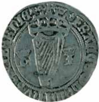
Toistiún (ceithre phingine), airgead, Anraí VIII agus Jane Seymour, 1536-1537. Ba le linn réimeas Anraí a baineadh úsáid den chéad uair as an gcláirseach mar shiombail d'Éirinn. Eisíodh an chéad 'monaíocht chláirsí' idir 1534 agus 1540 agus bhí céadlitreacha Anraí agus banríon an trátha sin uirthi

Léirítear an scéal polaitiúil ag tosú le Cogadh an Bóinne, le boinn a chomórann imeachtaí faoi leith. Léiríonn an chuid deiridh den taispeántas forbairt na mbonn in Éirinn sa 19ú haois, a úsáideadh ansin chun aitheantas a thabhairt d'fhiúntas nó chun fiúntas a chothú i réimsí éagsúla.