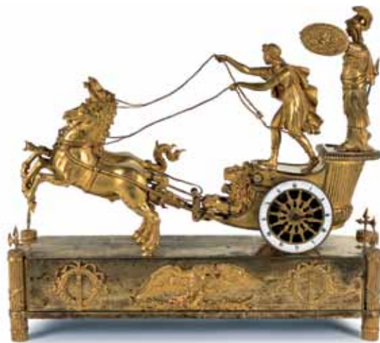
Clog, Francach, c. 1800. Diail i bhfoirm roth carbaid. Corp comhdhéanta de dhá chapall á dtiomáint ag fíor fireann, faoi chosaint Minerva (bandia na gaoise.)

Tá roinnt gléasanna tábhachtacha eolaíochá ón 17ú haois anonn go dtí an 20ú haois sa tsaoráid seo, mar aon le bailiúcháin uaireadóirí an mhúsaeim. Baineann an chuid is mó díobh leis an tréimhse 1750–1850. Tá bailiúcháin de phláta airgid Sheffield, leictreachlónna, péatar, práis, cré-umha, airgead agus seodra, le feiceáil sa cheathrú mhír den stór.