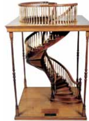
Samhail de staighre bíse, mahagaine, le Sherrin and Dowling, an Astráil, 1909.