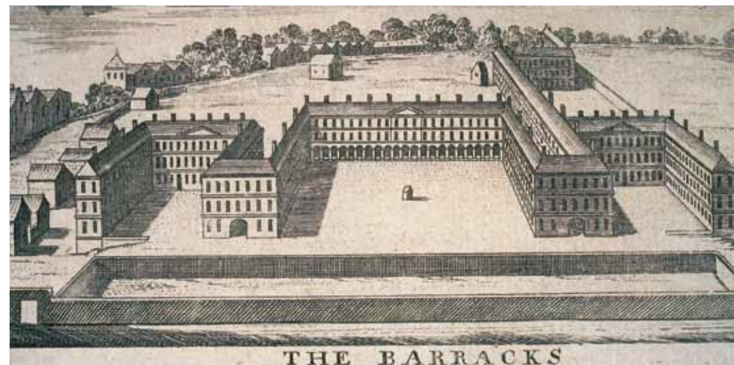
Radharc den bheairic, a tógadh ó 'A Map of the city and suburbs of Dublin', le Charles Brooking, 1728.

Dintiúr dátaithe 6 Márta 1704 a aistríonn úinéireacht Ghairdíní an Pháláis chuig na hiontaobhaithe le haghaidh tógáil na beairice in Éirinn.