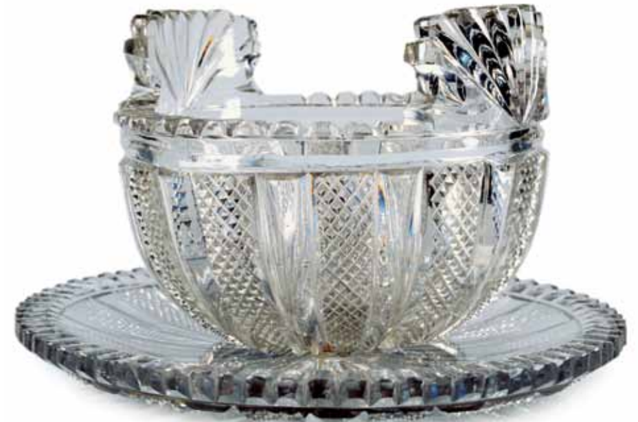
Babhla agus seastán a rinneadh i Loch Garman, c. 1820. Ba é seo an chéad mhír de ghloine ársa na hÉireann a fuair an Músaem Eolaíochta agus Ealaíne.

Sa bhliain 1877, rith an rialtas Acht Parlaiminte chun músaem nua a bhunú i mBaile Átha Cliath, ag súil 'go mbainfeadh muintir na hÉireann lánbhuntáiste as an deis feabhas a chur ar shaothrú na n-ealaíon tionsclaíoch agus maisiúil'. Le comhairle ó mhúsaem South Kensington i Londain, thosaigh oifigigh ag ceannach míreanna láithreach ó bhailiúcháin phríobháideacha idirnáisiúnta iomráiteacha. Roghnaíodh míreanna comhaimseartha díreach ó Tiffany agus William de Morgan, mar shampla, chomh maith le déantóirí níos gaire do bhaile, Vodrey, Pugh agus Béal Leice. Bailíodh saothair chomh maith chun doiciméadú a dhéanamh ar 'chliabháin shibhialtachtaí an domhain' – an Mheánmhuir chlasaiceach, an India agus an tSín. Dhirigh an institiúid nua chomh maith ar mhíreanna a léirigh forbairt thionsclaíoch agus eacnamúil in Éirinn, go háirithe ón 17ú aois ar aghaidh. Mar thoradh ar a bheartas fuinniúil ceannaigh, tháinig méadú mór ar na bailiúcháin. Go deimhin, nuair a d'oscail an t-áitreabh nua i Sráid Chill Dara sa bhliain 1890 b'éigean roinnt bailiúcháin a fhágáil ar taispeánt i dTeach Laighean ceal spáis.