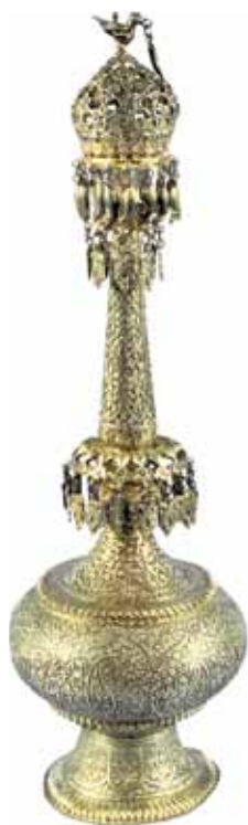
Gulabpash nó croiteoir rósuisce, airgeadaithe le maisíú clasach de bhláthanna, duilliúr agus scrollaí. Kashmir, an dara leath den 19ú haois.

Is é an taispeántas fadtéarmach is déanaí ar shuíomh Dhún Uí Choileáin ná an mhír 'Cad atá sa Stór?', lonnaithe i mBloc Thoir Chearnóg Uí Chléirigh. Osclaíodh é don phobail i mí na Samhna 2004. Cuireann an áis seo roinnt de na bailiúcháin is tábhachtaí ón Rannán Ealaíne agus Tionsclaíochta den Ard-Mhúsaem ar fáil don phobal. Is í an chead uair i stair na hinstiúide go ndeachthas i ngleic le stóras feiceálach a chur ar fáil. Tá an bailiúchán cúltaca uile de ghloine, d'ealaín fheidhmeach na hÁise, d'airgead agus de mhíotalóireacht ar taispeáint, agus ábhar ó Éire, ón mBreatain, ón Eoraip, ón Mheánoirthear, ón India, ón bPacastán, ó Bhurma, ón tSín, ón tSeapáin agus ó Tibet ina measc.