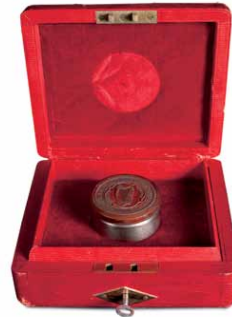
Séala Shaorstát Éireann, arna dhearadh ag an ealaíontóir Archibald McGoogan, a bhí ar an gcéad ghrianghrafadóir a d'fhostaigh an tArd-Mhúsaem chomh maith.

Tá Séala Mór Shaorstát Éireann, a dhátaíonn go thart ar 1925, ar taispeántas chun an tréimhse seo a chur in iúl. Ba é Archibald McGoogan an chéad ghrianghrafadóir sa mhúsaem a bhí níos déanaí ina choimeádaí ar na huirlisí ceoil agus na huiscedhathanna. Ar taispeántas chomh maith tá ciseáin d'uibheacha, don mhargadh, d'im agus do phrátaí – gnáthrudáí a bhain le saol na hÉireann a rinneadh as ábhar a bhí ar fáil go háitiúil.