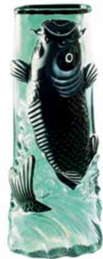
Vása carbáin, gloine chásaithe, arna dhéanamh ag Eugène Rousseau in 1880. Ceann de roinnt míreanna a cheannaigh Ard-Mhúsaem na hÉireann ó stiúideo an ealaíontóra ab ea é seo.