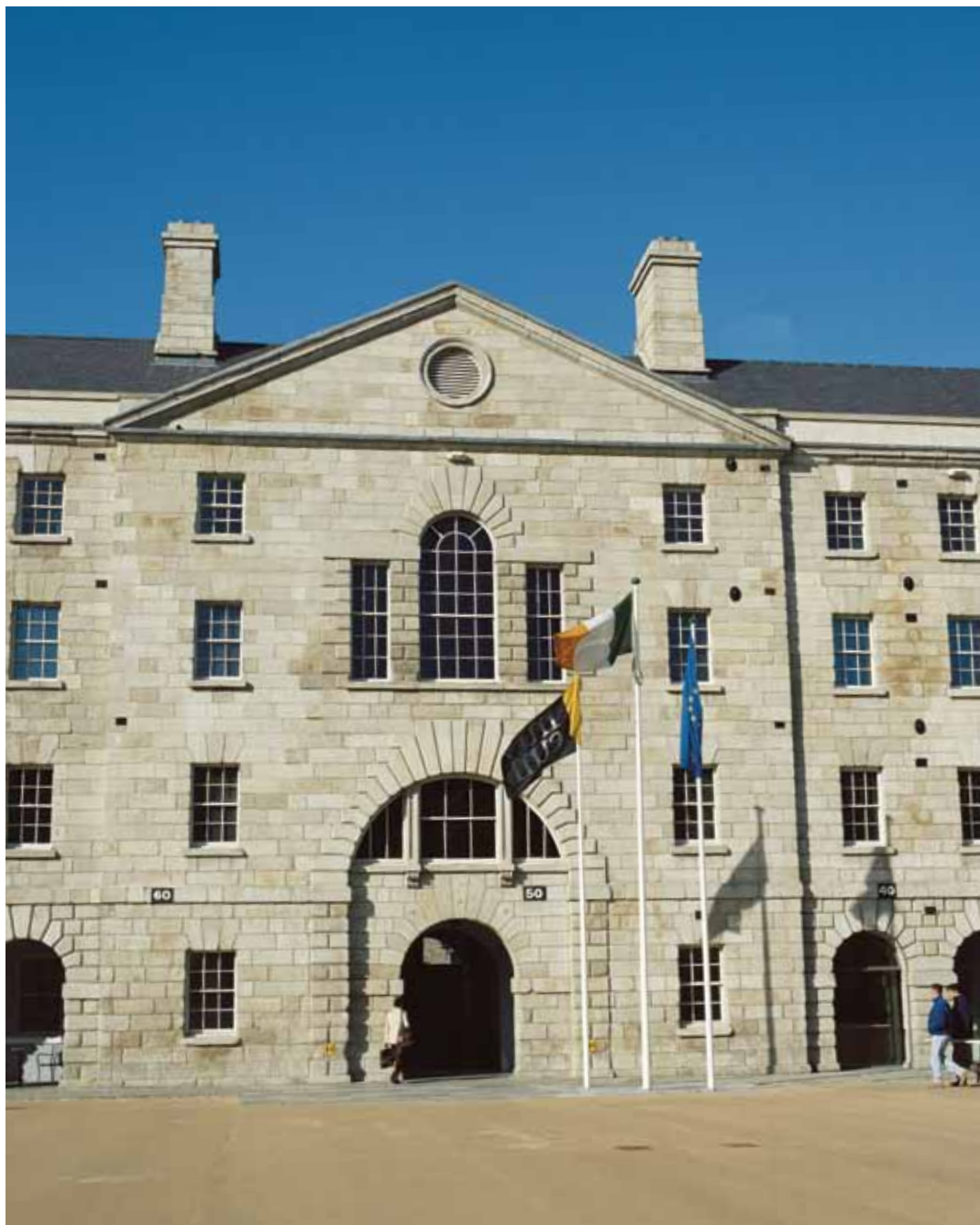
Radharc de bhloc thiar Chearnóg Uí Chléirigh, ag taispeáint an bhealaigh isteach sna taispeántais. De réir traidisiúin, tógadh an pasáiste agus an fhuinneog sa bhealach áirseach ionas go bhféadfadh an Bhanríon Victoria fanacht laistigh agus í ag léirbhreithniú a cuid trúpaí.