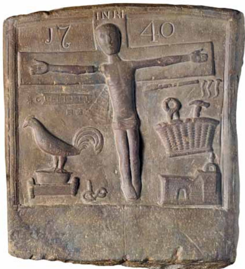
Cloch altóra ó Chnoc an Línsigh, Co. na Mí, den 18ú haois. Snoite air tá siombailí de chéasadh Chríost ar nós an chasúir, na tairní agus an gha.

I gcontrárthacht leis sin tá an cloch taobh leis greanta le siombailí de Pháis Chríost. Leis na céadta bliain agus i gcomhthéacs idirnáisiúnta, rinne idir bhocht agus shaibhir dianmhachnamh ar na siombailí seo. De réir an traidisiúin fuarthas an chloch seo a snoíodh go háitiúil i seomra beag a bhí dúnta suas i gCnoc an Línsigh, Co. na Mí. Tá an dáta 1740 air agus ceaptar gur cloch altóra é a úsáideadh i rith thréimhse na bpéindlíthe, nuair a bhíodh an t-Aifreann á rá i dtithe dá leithéid agus ag carraigeacha Aifrinn.