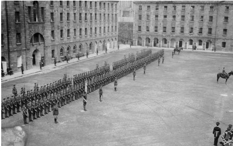
An 1ú Cathlán, 62ú Reisimint (Wiltshire) ag a bParáid Lá Ferozeshah sa Bheairic Ríoga, Baile Átha Cliath, i 1921. (Chomóir an pharáid bhliantúil seo Cath Ferozeshah, a troideadh ar an 21ú agus an 22ú Nollaig 1845, le linn an Chéad Chogadh Saiceach i dTuaisceart na hIndia. Ba é an Gael, Sior Hugh Gough, a bhí mar ardcheannasaí ar an reisimint le linn an chogaidh seo.)

Moladh ansin go leagfaí an chuid is mó de na seanfhoirgnimh, agus an scoil mharcaíochta san áireamh. Ba é an plean a bhí ann ná go bhfanfadh coisithe sa Bheairic Ríoga agus go rachadh marcshlua go beairic a bhí á tógáil i nGráinseach Ghormáin (Dún Mhic Aodha inniu).