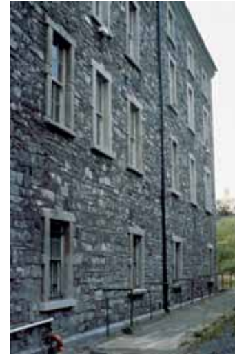
Baint na seomraí níocháin agus na bhfualán oíche, a tógadh c. 1891, agus athchóiriú bhalla an Bhloic Thuaidh de réir an dearaidh bhunaidh. I ndiaidh aistriú na beairice chuig an Ard-Mhúsaem, chuir Oifig na nOibreacha Poiblí, in éineacht leis na hailtí Gilroy McMahon, tús leis an tasc Cearnóg Uí Chléirigh a athchóiriú de réir mar a bhí sé san 18ú haois.

Níos lú na fiche bliain tar éis na n-athruithe móra ailtireachta seo ghlac an bheairic páirt mhór i gcúrsaí míleata nuair a coinníodh sluaite móra de shaighdiúirí ann chun seirbhís a thabhairt i rith an Chéad Chogaidh Dhomhanda. Maraíodh nó gortaíodh an t-uafás agus iad ag troid sa chogadh.